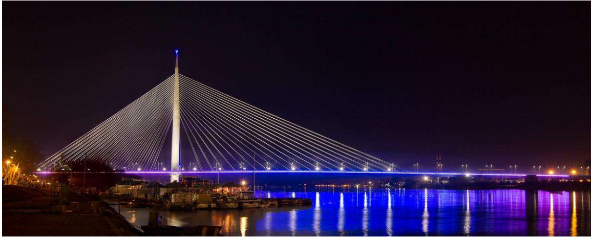
Most Adi v Belehrade