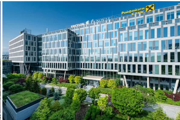
Expo 2000 park Sofia