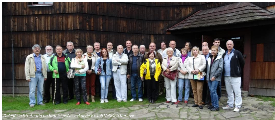
Delegácia Stretnutia na hranici počas exkurzie v okolí Veľkých Karlovíc.

V českých Veľkých Karloviciach sa od 19. do 21. septembra uskutočnilo 9. stretnutie na hranici. Ide o tradičné podujatie českých a slovenských inžinierov, kde prerokujú vždy aktuálne problémy, ktoré komory a zväzy týchto susedných krajín riešia v stavebnej oblasti. Tento rok rozpúťali živú diskusiu príhovory predsedov slovenskej a českej komory, ktoré sa týkali prevažne prípravy právnych predpisov. Dominovala príprava nášho stavebného zákona a novela stavebného zákona u susedných partnerov v roku 2016. Účastníci stretnutia po rokovaní navštívili hrázdené a zrubové stavby v okolí Veľkých